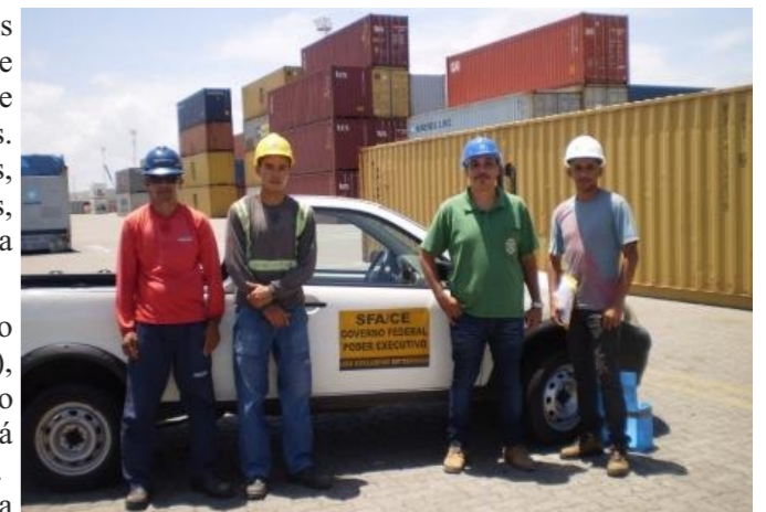
Equipe composta por representante do Mapa, Cearáportos e Logística (despachante e auxiliar)

O Terminal de Múltipla Utilidade foi projetado para operação de carga geral, contêineres e produtos siderúrgicos para sobrecarga de 10,0 toneladas/m 2 e operação de guindaste de pórtico com 30,48 metros (100 pés) de bitola. O pátio foi construído obedecendo rigorosamente às especificações exigidas pelos órgãos de regulação ambiental, recebendo calhas para contenção de vazamentos e tanques de retenção de produtos.