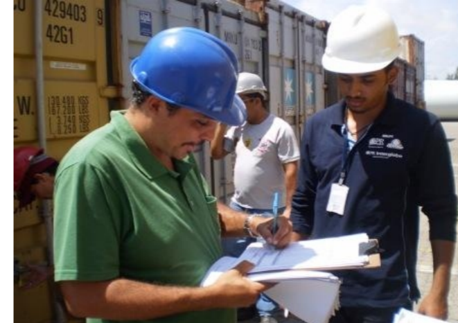
Fiscal federal agropecuário autoriza a liberação de mercadorias

Com o objetivo principal de garantir a qualidade dos produtos, segurança vegetal e animal contra a introdução de pragas, é realizado um trabalho de fiscalização física e documental, tanto das mercadorias importadas como exportadas. Os produtos fiscalizados são frutas, produtos ornamentais, sementes, agrotóxicos, fertilizantes, bebidas, matérias-primas, pescados, madeiras, entre outros. Quando necessário, é solicitada a presença da Receita Federal, Polícia Federal, Ibama e Anvisa.