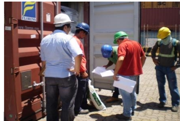
Fiscalização é realizada para garantir a qualidade dos produtos

Segundo dados da Unidade de Vigilância Agropecuária (UVAGRO), durante o ano de 2013 foram realizadas no TMULT uma média de 22.945 fiscalizações. A defesa vegetal possui maior fluxo, com aproximadamente 20.130 processos nesse mesmo período.