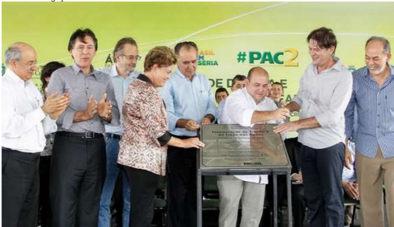
O evento contou com a participação da presidenta Dilma Russef, governador Cid Gomes, prefeito Roberto Cláudio e outras lideranças políticas

No último dia 19, dia do padroeiro do Ceará, São José, a presidenta Dilma Rousseff visitou o Parque de Exposições Governador Cêsar Cals, onde fez a entrega de 172 máquinas agrícolas para beneficiar 141 municípios cearenses, pelo Programa de Aceleração do Crescimento (PAC 2).